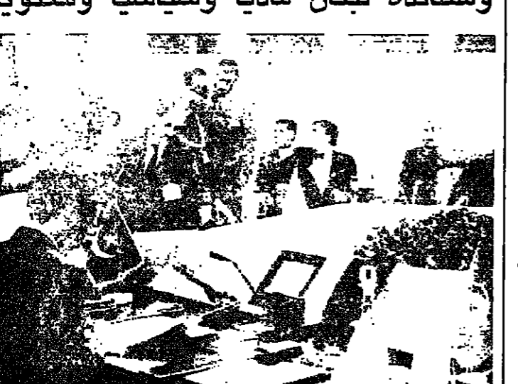
زعماء اتحاد المغرب العربي خلال التوقيع على الاتفاق

وقال بوش في الرسالة التي سما فيها مبارك مع وزير الخارجية بيفيد ليفي والثلاثين للورة ٢٣ يوليو ١٩٥٢ المشتركة والعمل معاً ان تحقق اهدافنا المشتركة والمغربية في احوال السلام في الشرق الاوسط. وكان بوش في رسالته ايضا، وبعثنا المشتركة في تعزيز العلاقات بين شعبيها.